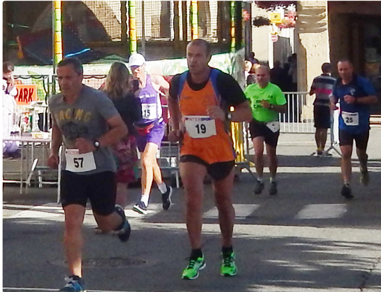
MIRANDE Course pédestre de 10kms