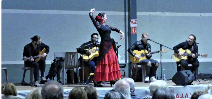
Auch-Calatayud et le fameux "chocolate con churros"