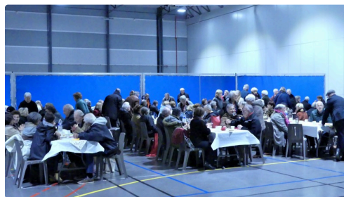
Tout est excellent