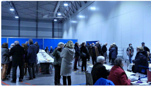
Pendant la "balance" de l'orchestre, on tchatche.