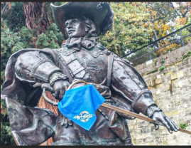
La statue de d'Artagnan à Maastricht avec le foulard de l'association