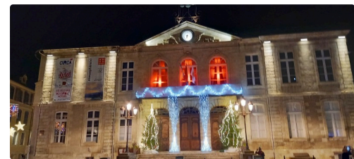
La mairie d'Auch.