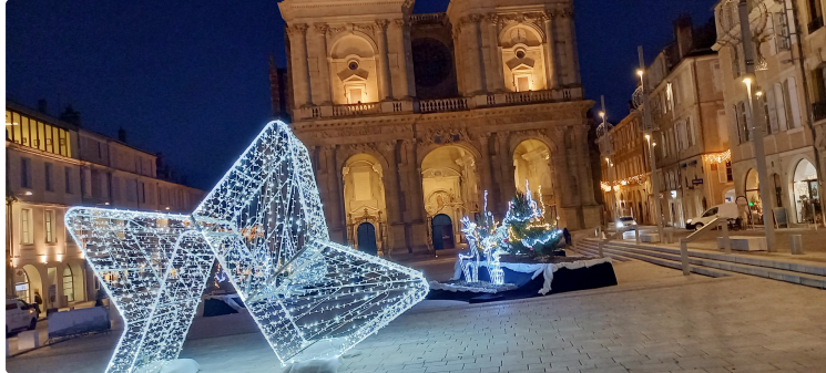
Le parvis de la cathédrale donne le ton des illuminations de la ville d'Auch

Après le renne qui traînait le charriot du Père Noël, puis le puissant ours qui impressionnait au milieu du parvis de la cathédrale, cette année « c'est une étoile géante qui fait office de porte d'entrée vers un monde féérique composé de trois scénettes avec ses sapins agrémentés de guirlandes lumineuses et ses rennes du plus bel effet », détaille Cathy Daste-Leplus adjointe au maire d'Auch. A noter aussi la présence de deux grosses boules lumineuses de plus de 2,50 mètres de diamètre entièrement réalisées par les agents du service Manifestations de la ville d'Auch. Cathy Daste-Leplus précise que « ce décor extraordinaire est plus particulièrement l'œuvre d'un agent qui a exercé la profession de décorateur pour Disney ».