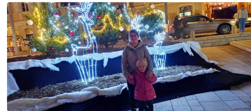
Deux jeunes filles posent devant les rennes.