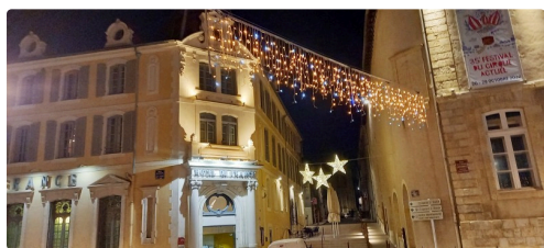
Trois étoiles pour la rue André Daguin.