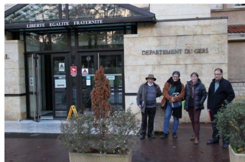
Délégation reçue au Conseil départemental

Le contact est établi. Reste à aplanir les divergences.