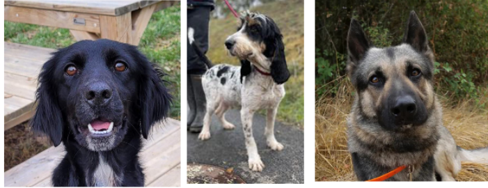
Les stars de la semaine : Dora, Polux et Chinky

Cette semaine, la SPA vous présente trois nouveaux venus qui ont hâte de vous rencontrer.