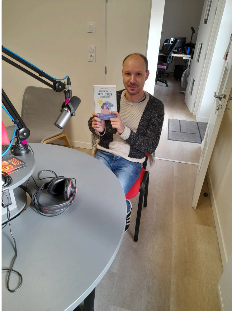
Programme de la semaine prochaine à Radio Fil de l'Eau