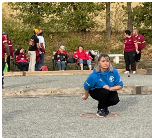
petanque mirande 5.jpeg.jpg