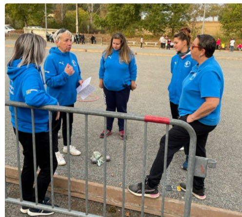
petanque mirande 7.jpg

Après 2 années tronquées et un redémarrage au ralenti, on peut tout de même être satisfait des résultats du club qui va avoir l'occasion de définir des objectifs certainement plus élevés lors de l'Assemblée Générale du samedi 10 décembre 2022 à 10 heures au boulodrome Yves Menu où la présence de tous les licenciés est indispensable ainsi que de tous les joueurs qui souhaitent faire partie de l'aventure en 2023.