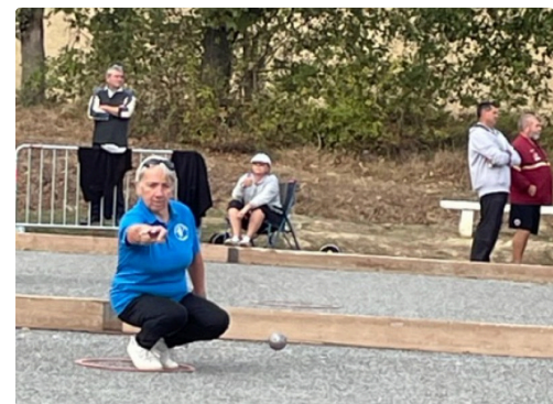
petanque mirande 3.jpeg.jpg