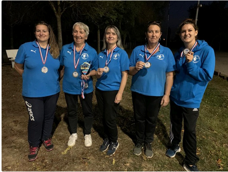
Pétanque : Les filles en avant