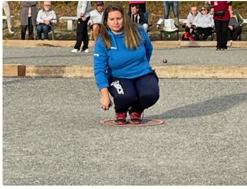
petanque mirande 6.jpg