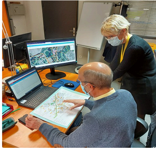
Pour de meilleurs services des adresses plus précises