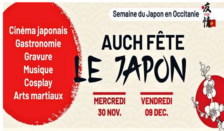
La ville d'Auch comme l'Occitanie fête le Japon du 30 novembre au 9 décembre