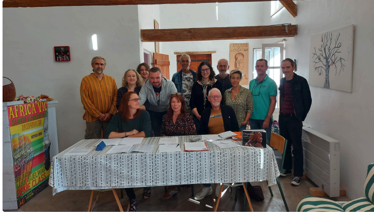
Africa' Vic, des effectifs en hausse et de nombreux projets sur les rails !

Le 22 octobre 2022, les membres de l'association Africa'Vic ont tenu à la Maison Bleue leur Assemblée Générale Ordinaire.