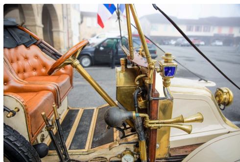
5 La Renault AX de 1909 côté droit 1bis 111122.jpg