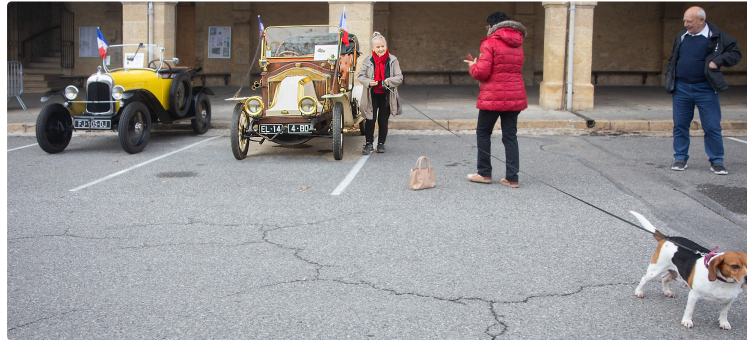
Une superbe Renault de la Belle Époque (1909) à Aignan

Venue de L'Isle-de-Noé avec une Citroën de 1922