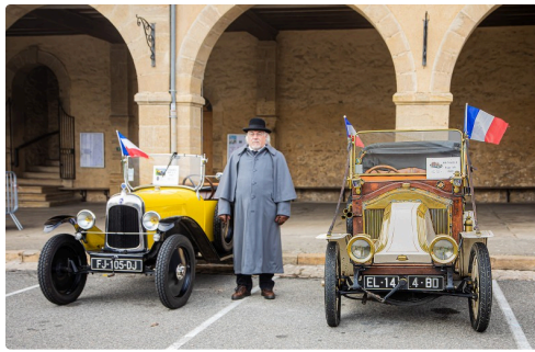
Vue des 2 voitures