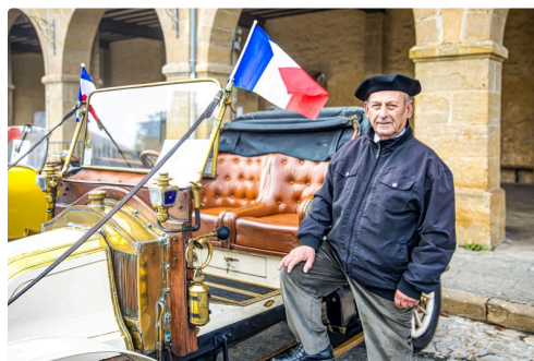
2 La Renault AX de 1909 1bis 111122.jpg