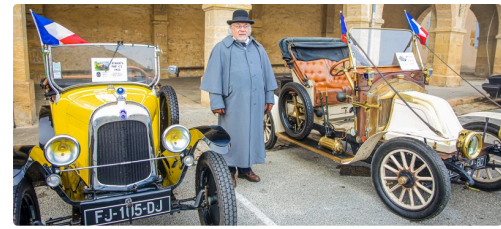
Les mêmes plus près