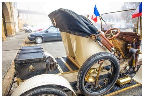
4 La Renault AX de 1909 côté droit 1bis 111122.jpg