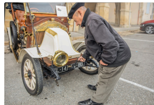
6 Démarrage à la manivelle 1bis 111122.jpg