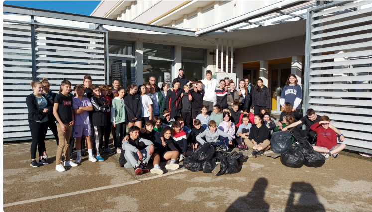
Une journée autour des valeurs de partage, biodiversité, respect et entraide au collège Gabriel Séailles

Les ateliers communs à toutes les classes