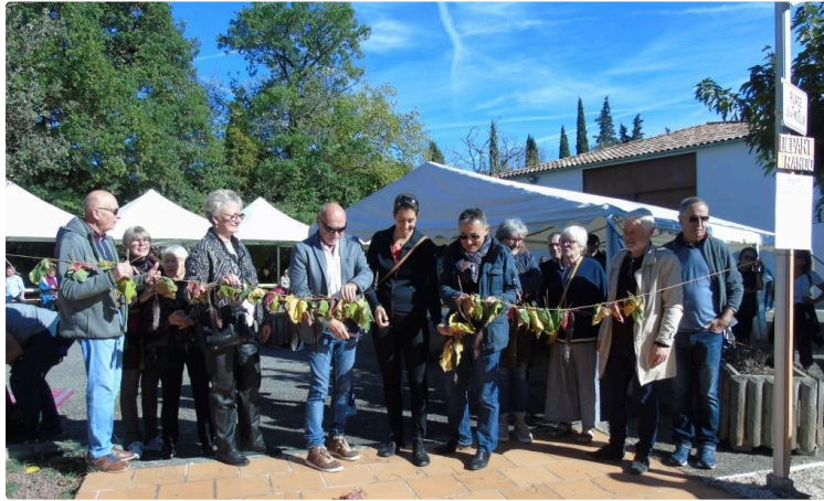
17 ème Fête de l'Arbre 2022 : une superbe journée pour le chaland