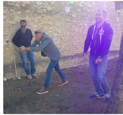
Han! Monsieur le maire lanceur de hache