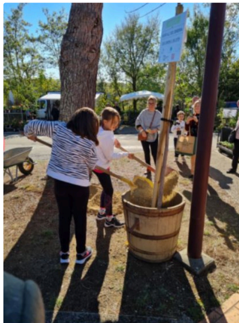
plantation de l'Arbre de la Fête