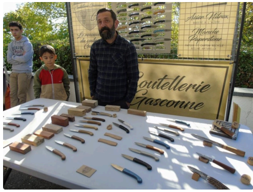
des couteaux nouvelle génération