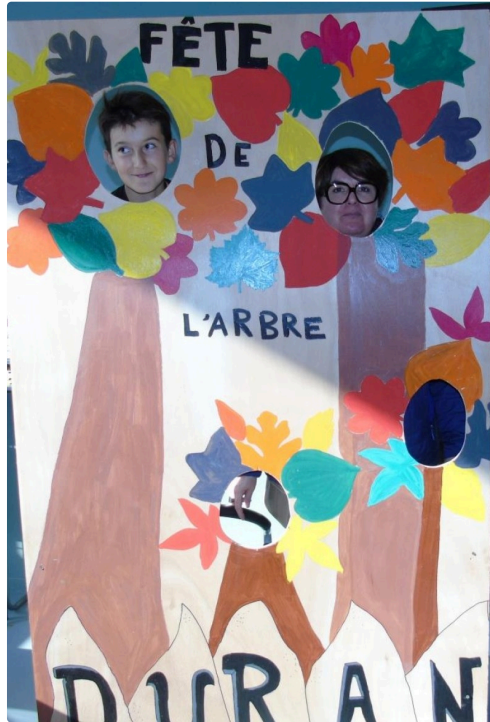
photomaton made in Duran