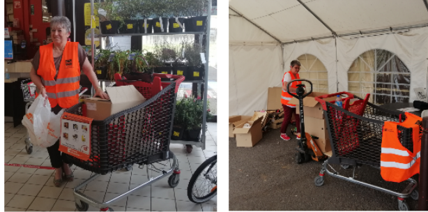
A quelques jours de la collecte nationale, rencontre avec le président de la Banque Alimentaire du Gers

Le vendredi 25 et le samedi 26 novembre, les bénévoles de la Banque Alimentaire du Gers seront présents aux entrées des deux grandes surfaces vicoises, Carrefour Market et Intermarché comme dans 44 autres magasins du Gers pour collecter des produits de première nécessité.