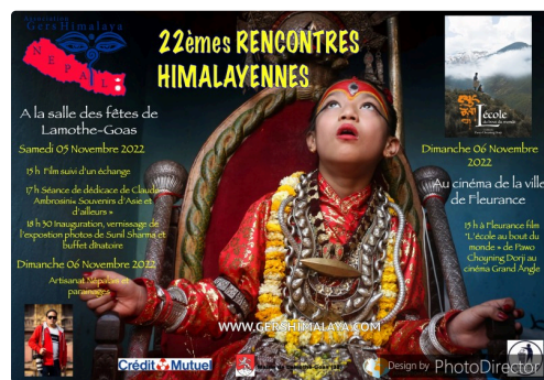
Sunilsharma_Living Goddess Kumari(1).jpg

15 H Adhésions et parrainages de scolarité d'enfants népalais, dons.