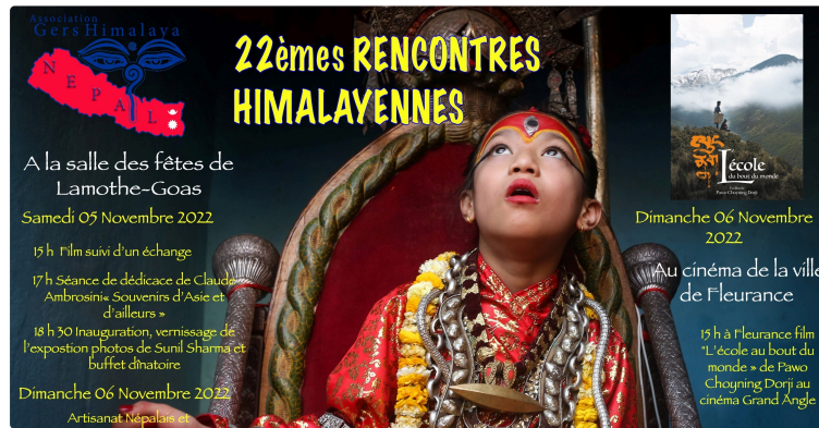
Les journées Himalayennes

Samedi 5 novembre et le lendemain dimanche 6 novembre, vont se dérouler les traditionnelles journées himalayennes, temps fort annuel pour l'association Gers Himalaya. Cette année des animations seront sur deux sites : Lamothe Goas et Fleurance, dans le Gers.