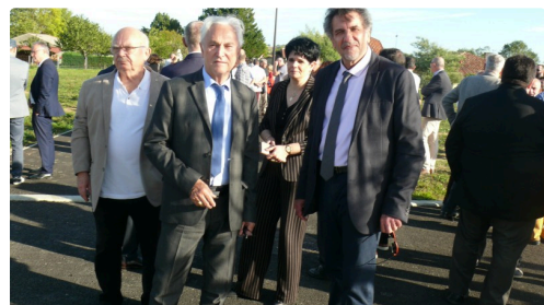
Visite du lotissement écoresponsable.