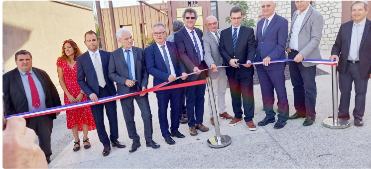
La Maison de santé et le lotissement écoresponsable inaugurés

Deux opérations qui offrent une grande attractivité pour la commune de Saramon