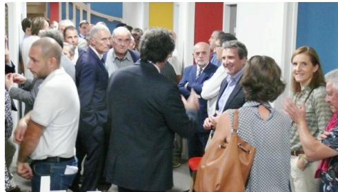
Beaucoup de monde dans les couloirs