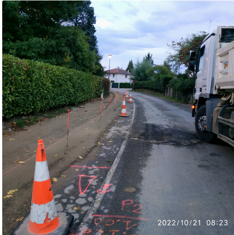
Les travaux sur le chemin de ronde avancent.

Communiqué de la mairie relatif aux travaux de voirie