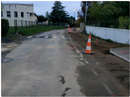
Chantier chemin de ronde