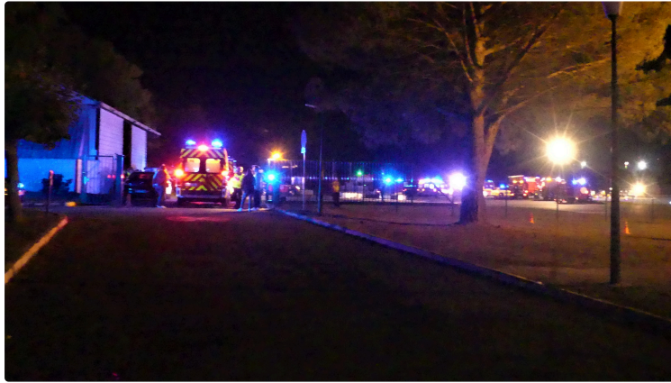
Crash à l'aéroport d'Auch

Exercice de sécurité civile déclenché par la préfecture