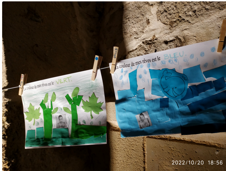
La Grande Lessive