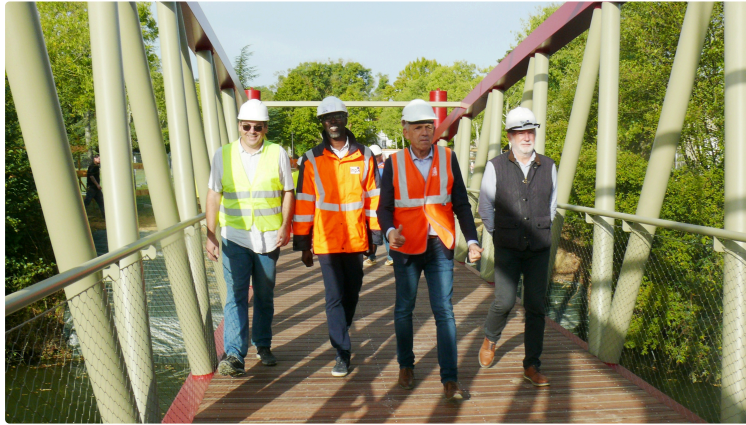
Une sixième passerelle posée sur le Gers

Elle permettra de relier la rue du 8 Mai au parc du Couloumé au niveau de la salle Ernest Vila.