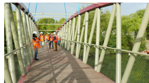
Vue de la passerelle.