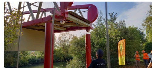
Tout se joue au millimètre près.