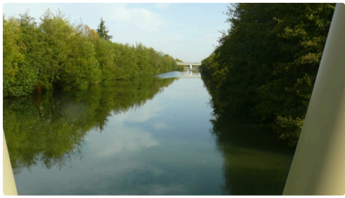
Vue sur le pont près du barrage.