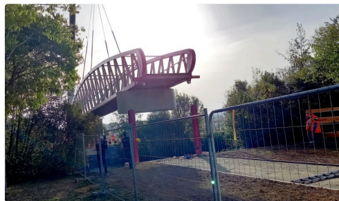
Début de la pose de la passerelle.