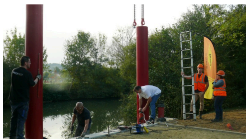
Dernières finitions avant la pose.