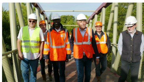
Le maire et les responsables du chantier.