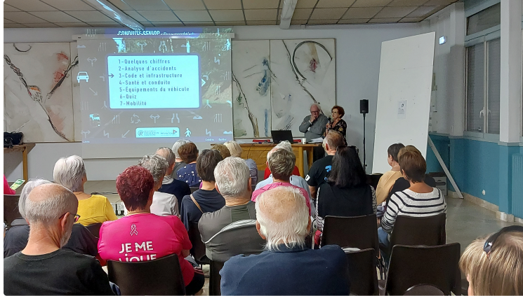
Une très utile séance de révision du code de la route !

L'association vicoise la Bienfaisance avait organisé samedi une séance de « révision » de la sécurité routière dans la salle des conférences de la mairie.