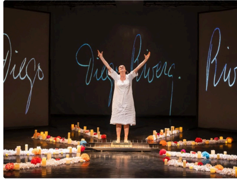
008pg20220219_1 frida kahlo.jpg