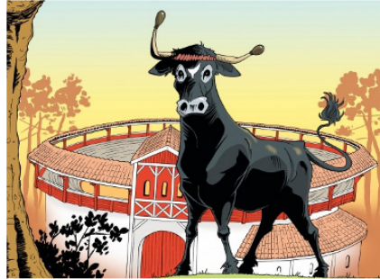
"Ironda, reine des arènes", l'univers de la course landaise en bande dessinée

Vient de sortir aux éditions Passiflore une bande dessinée, Ironda, reine des arènes , œuvre de Patrice Larrosa pour le texte et David Dupouy , illustrateur.