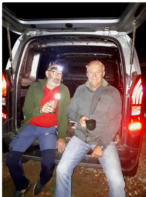
Moment de réconfort dans la nuit autour d'un vin chaud