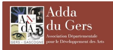
L' actu de l'ADDA du Gers en octobre

Marc Fouilland a réuni les acteurs des événements pour octobre