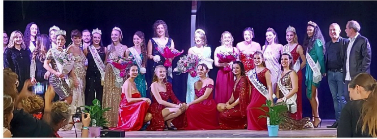
Miss Élégance Gers Bigorre, c'est à Vic-Fezensac samedi soir !

Pour la 3eme année consécutive, Vic-Fezensac va accueillir l'élection de Miss Elegance Gers Bigorre 2022 qualificative pour Miss Élégance Midi-Pyrénées 2022