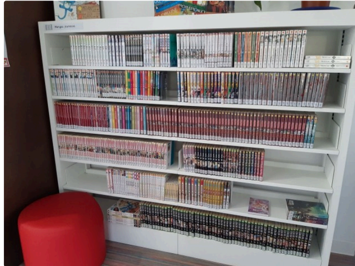
L'année Manga a commencé à la Médiathèque !