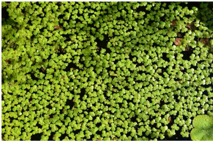
Un plan d'eau obstrué par les lentilles d'eau (photo "Promesse de fleur")

Quand les lentilles d'eau prolifèrent, c'est signe que le milieu devient eutrophique, c'est-à-dire qu'il est trop nourri en azote et en phosphore, principalement. Si l'on ne fait rien, elles finissent par obstruer la surface.