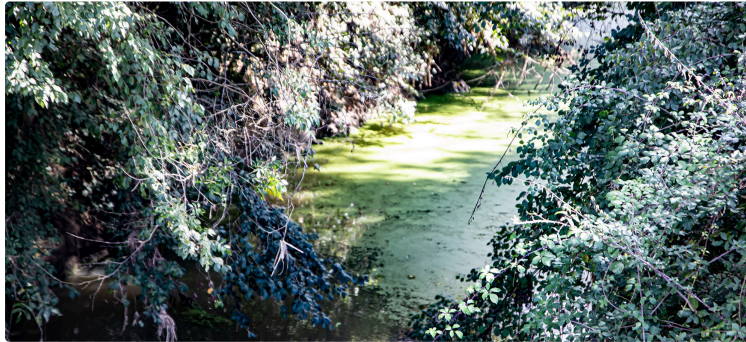
Les lentilles d'eau dans le Midour à Nogaro

Le débit pourrait être souvent trop faible l'été pour les chasser