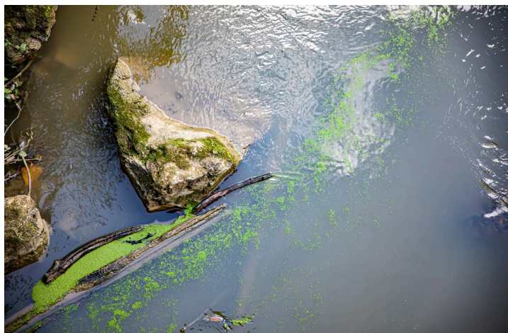
On distingue les bancs de lentilles qui se désagrègent au fil de l'eau

Le but de cette sortie était de voir quel était l'état du Midour. En effet, la sécheresse de l'été a beaucoup affecté celui-ci et Olivier Rosès voulait s'assurer que les lentilles d'eau n'avaient pas obstrué la surface de l'eau.