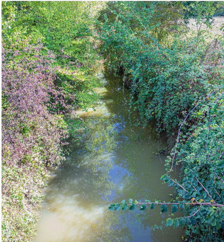
Les lentilles d'eau filent dans le courant