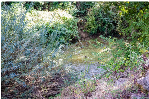
11 Le Midour au 2e pont 1bis 300922.jpg