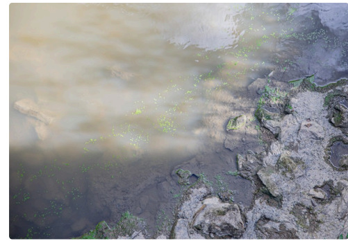
3 Les lentilles d'eau du Midour s'en vont 1bis 300922.jpg