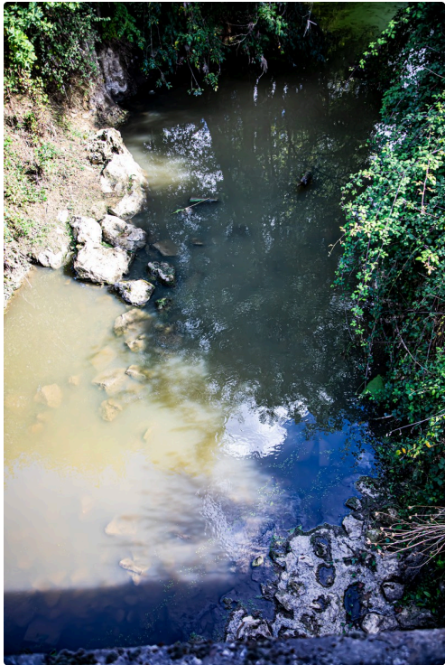
5 Midour au pont Nogaro côté gauche 1bis 300922.jpg