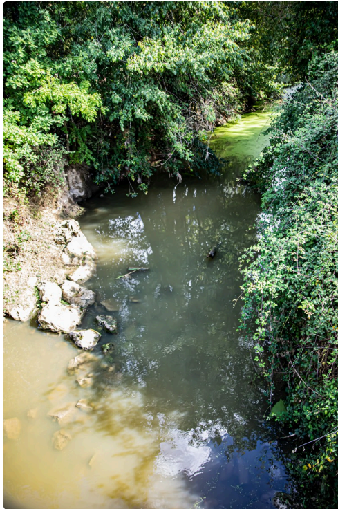
6 Midour au pont Nogaro côté gauche 1bis 300922.jpg