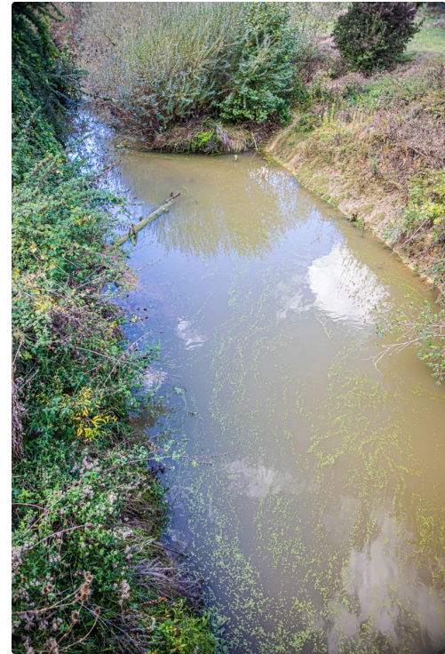
8L'eau est plus limpide au rétrécissement du fond 1bis 300922.jpg