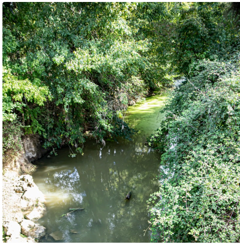
4 Midour au pont Nogaro côté gauche 1bis 300922.jpg