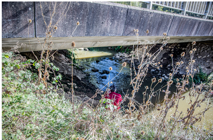
Sous le pont du Midour de la grand'route