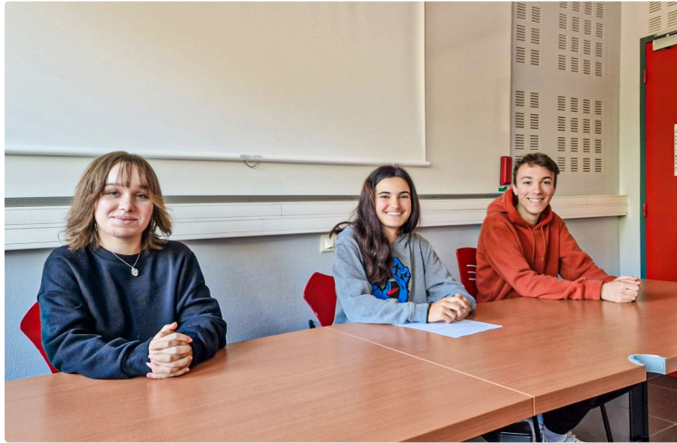
«Les HalluCinés» développent le cinéma à Nogaro

La junior-association en assemblée générale