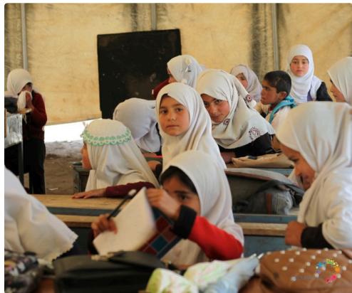
Tiré d'un prospectus de l'association "Afghanistan libre"

Cette année, dans un moment où certains prédisent la disparition du cinéma en salles, nous tenons à montrer que les films qui croient au cinéma existent, qu'il y a aussi une nouvelle génération de cinéastes qui monte, qu'il faut continuer à susciter de nouvelles générations de spectateurs, et que pour cela nous devons persévérer dans l'exigence et l'ouverture. ( https://www.independancesetcreation.com/ )».