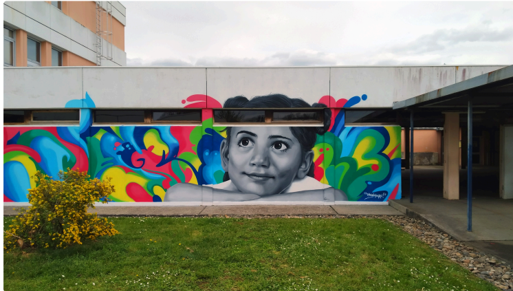
Entre deux réalisations de fresques murales, Panda Man expose à l'Office de Tourisme !

Nous vous l'avions présenté il y a un an suite à son intervention auprès des jeunes du CLAC ( fresque du skate park ) et nous avons ensuite suivi son actualité.