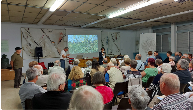
«Moulins de Fezensac, enquête-recensement», un bel ouvrage présenté par la section vicoise de la société archéologique et historique du Gers