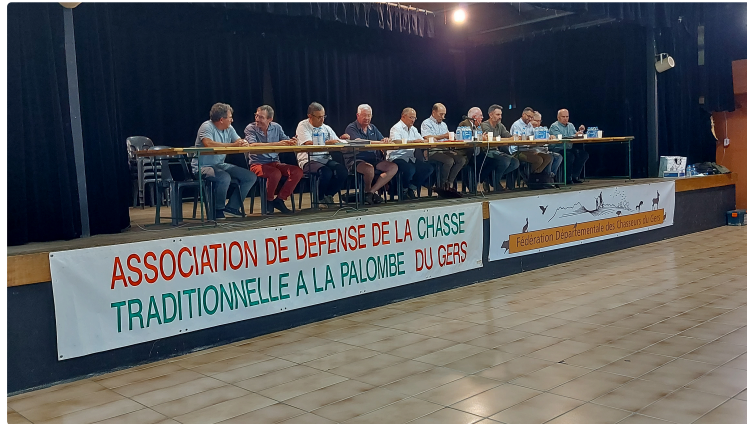
Réunion des chasseurs de palombes : des chasseurs inquiets quant au maintien des chasses traditionnelles