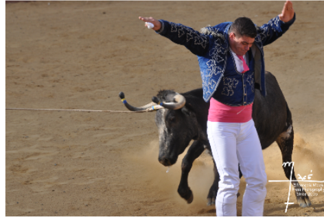
Quand la course landaise revient dans les arènes vicoises...

Le dimanche de la Saint Matthieu, comme par le passé, a résonné dans l'après-midi la marche de la Cazérienne.