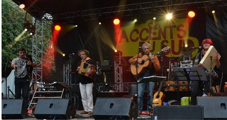
Journée gasconne - Eauze