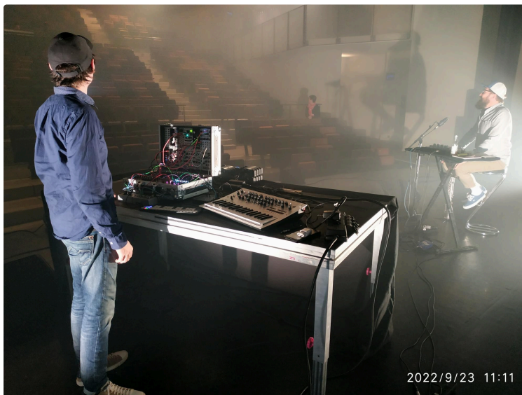
Marciac L'Astrada : sortie de résidence.

Vendredi 23 septembre 2022 à 18h30. Entrée libre.