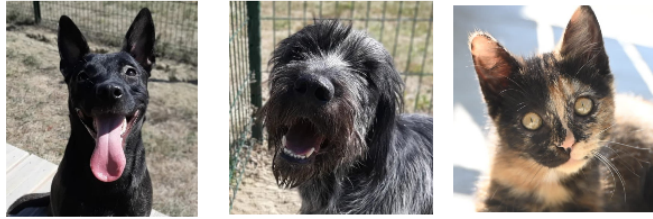
Deux jeunes chiens et une petite minette cette semaine !

Ils viennent d'arriver au refuge, ils sont tout jeunes et n'attendent que vous pour bien démarrer dans la vie !