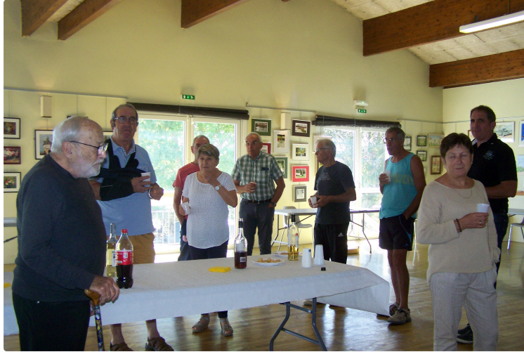
Une exposition des peintres amateurs des environs de Solomiac et d'ailleurs...