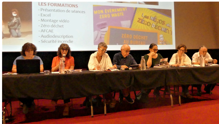
CINE32 poursuit sa route ...