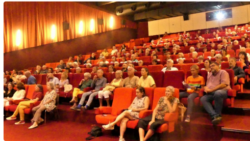
Une salle bien garnie d'adhérents