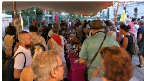
Le buffet post-AG très apprécié