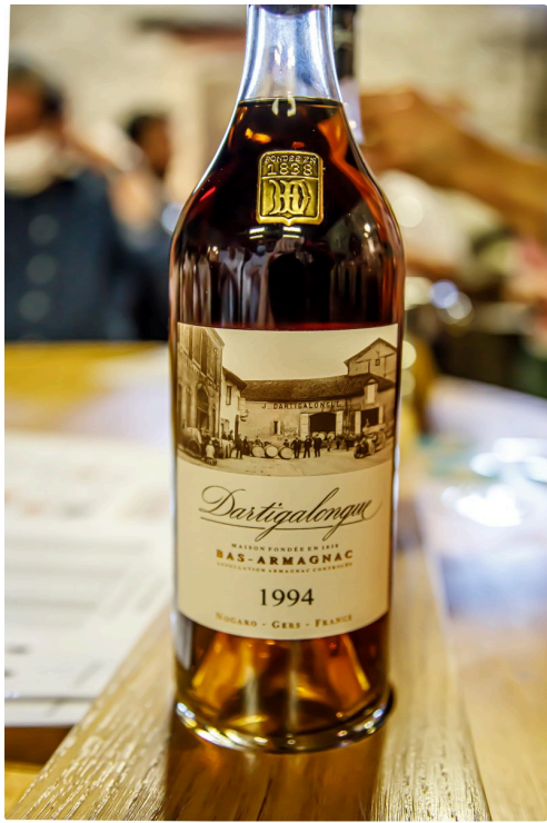
Le 1994 un "must" Dartigalongue