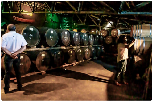
Chai du début de vieillissement