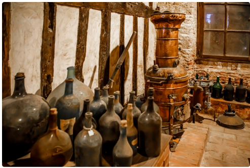
Parmi les trésors