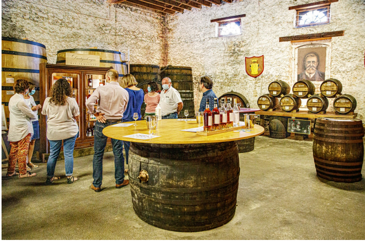
Salle de dégustation

Quand on redescend sur terre, on peut voir les cuves où les eaux-de-vie sont aérées tous les trois ans, puis la salle d'embouteillage et la salle de dégustation.