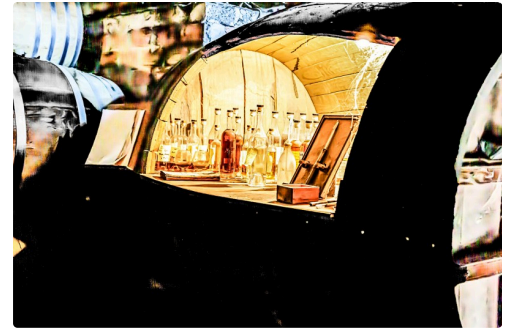
Petit trésor dans le chai