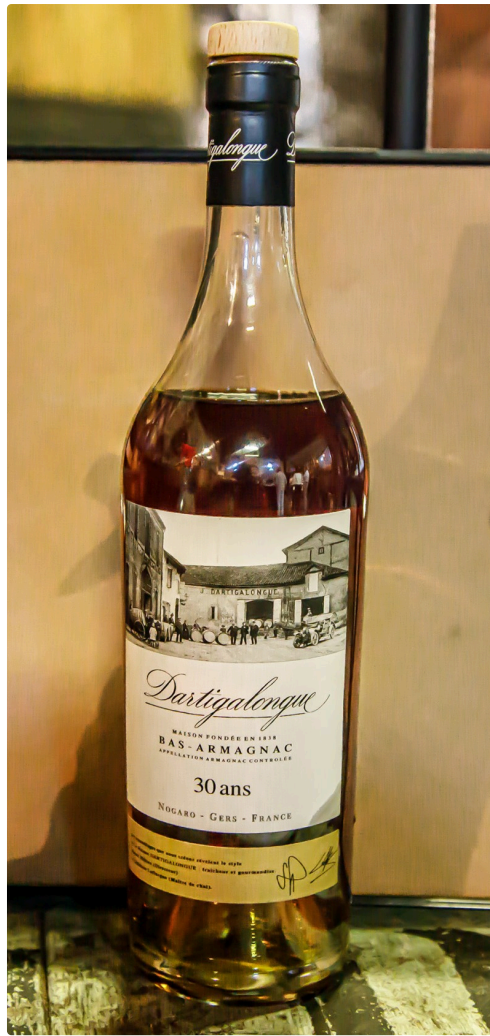
Le 30 ans d'âge autre "must" Dartigalongue