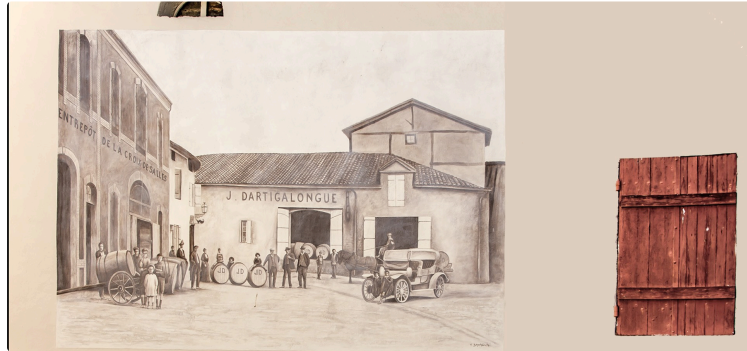
Les trésors des chais Dartigalongue ouverts les 17 et 18 septembre

Vous souhaitez un but de visite hors normes, original, dépayçant et très peu connu pour le weekend ? Appelez le 05 62 09 03 01.