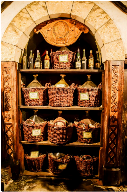
Parmi les trésors