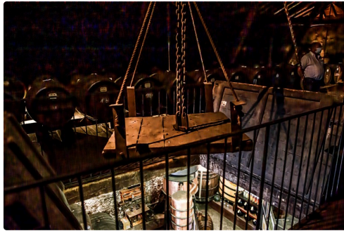
Chai de vieillissement et monte-charge