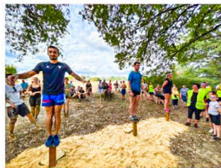
L'épreuve des poteaux