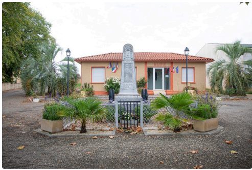
Mairie et monument aux morts de Sorbets