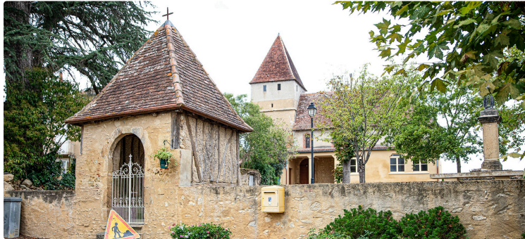
Nombreux temps forts à la Fête de Sorbets (20-21 août 2022)

Vide-greniers, soirée tapas-bal et Koh-Lanta