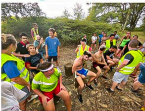
L'épreuve de dégustation