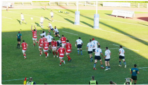
Phase de jeu.