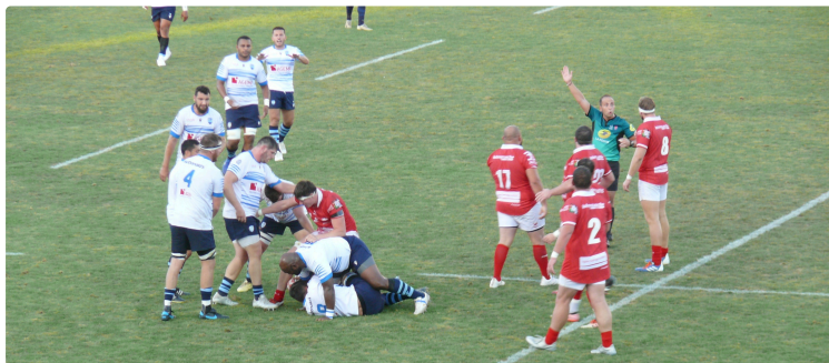
La fantastique remontada du RC Auch

Malmenés en première mi-temps, les Auscitains réussissent à revenir sur les Périgourdins pour les assommer par un drop à la dernière seconde de jeu