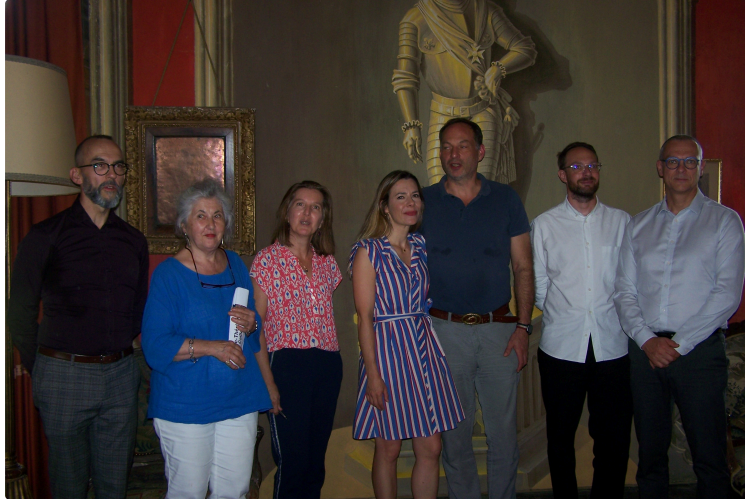
Des Cadets de Gascogne aux Mousquetaires du Roi : un événement culturel et artistique unique sur le territoire du Savès