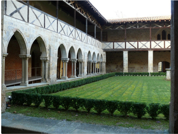
Journées européennes à l'abbaye de Flaran et autres musées