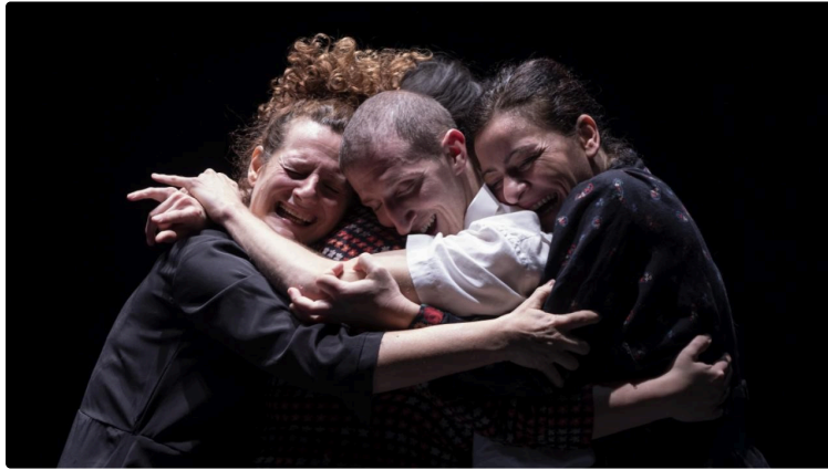
Nouvelle saison à l'Astrada: "Trouvailles et retrouvailles"

Présentation de la saison culturelle 2022-2023 à Marciac.