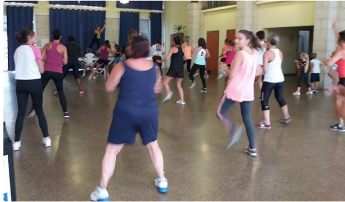
Zumba le bon tempo

Ce mercredi 7 septembre c'était la rentrée pour les inscriptions et les cours de Zumba dans la salle de la mairie du village thermal.