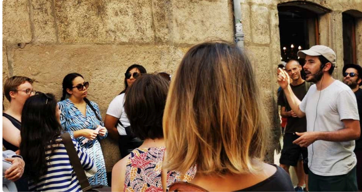
"Je suis invisible", exploration sensible et scientifique de l'ordinaire du village de Lavardens

La Petite Pierre présente "Je suis invisible", exploration sensible et scientifique de l'ordinaire