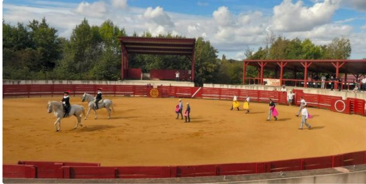
Rendez-vous à Seissan dimanche pour l'encuentro taurino !