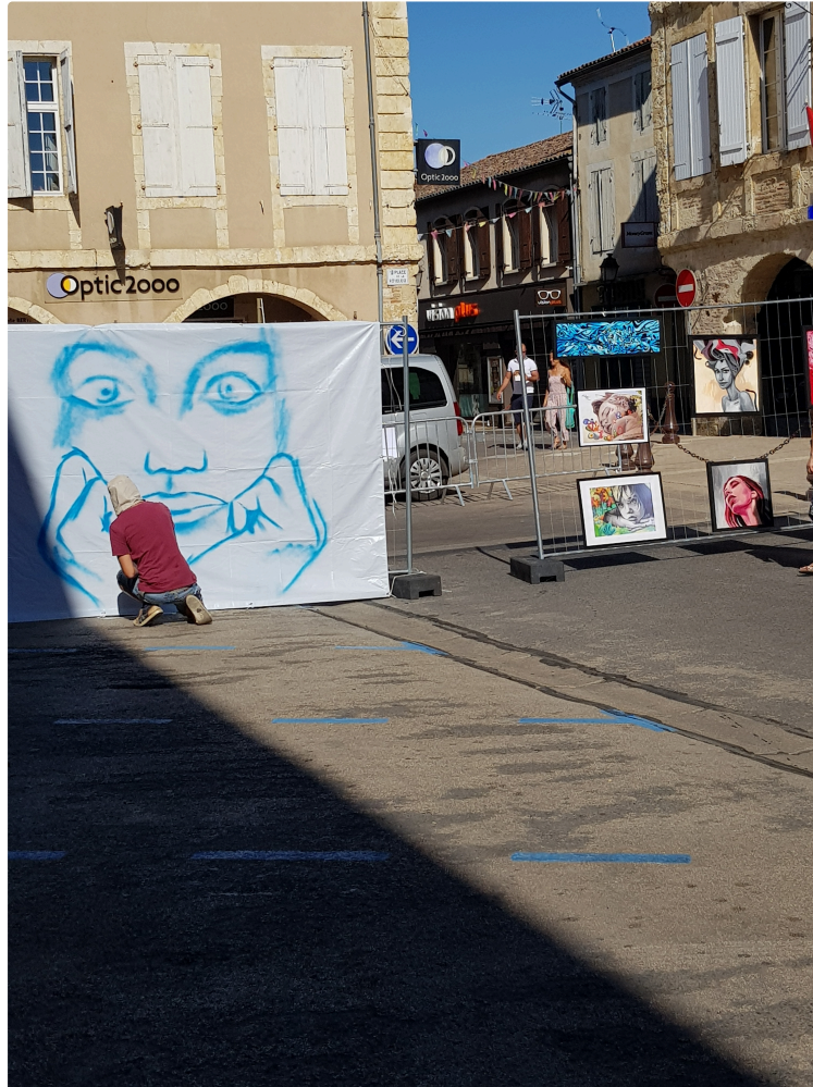
L'art a pris l'air sous les arcades et autour de la mairie de Fleurance

Photo : Savoir créer dans l'instant, tel est le talent d'une performance !