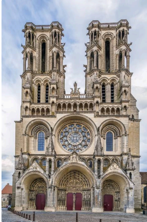
cathédrale de laon