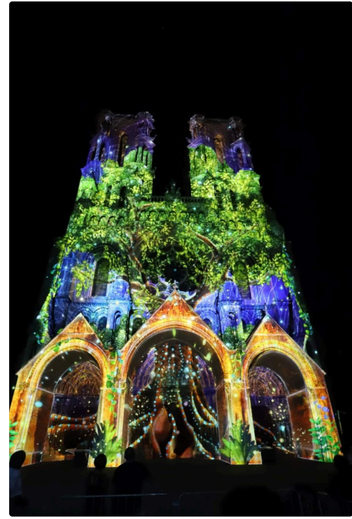
Souffle sur la Cathédrale de Laon