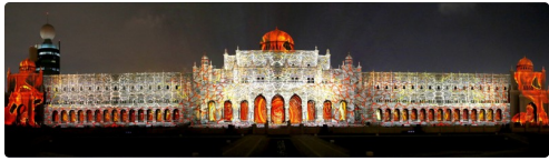
Sharjah Light Festival