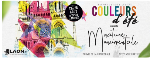
Place au spectacle numérique

Contact Rémy Laurençon : 06 66 89 32 31 ou remylauren@gmail.com