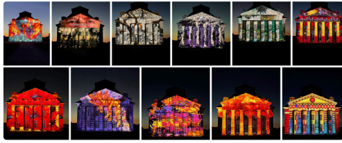
Artslide - ARC ET SENANS-Charles Belle